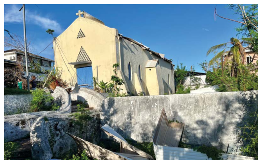
Chapelle Saint-Michel après le passage du cyclone Chido