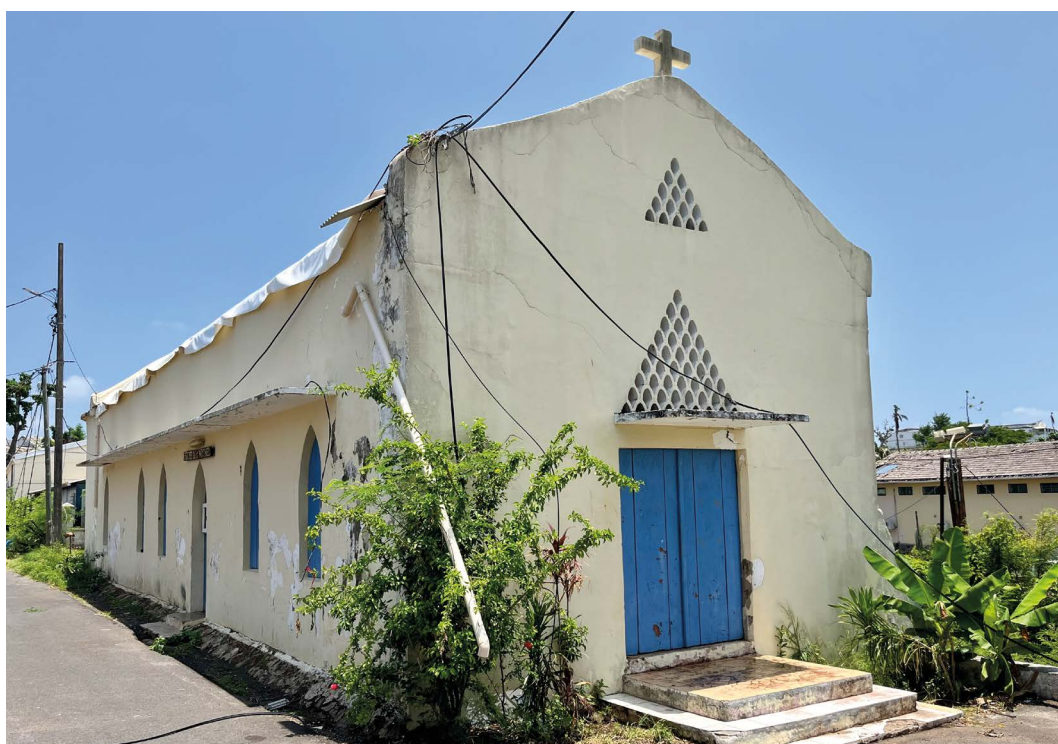
Chapelle Saint-Michel après le passage du cyclone Chido

Protection au titre des monuments historiques : en instance de protection