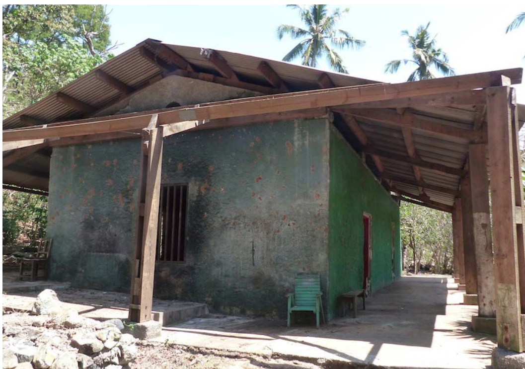
L'ancienne léproserie

Protection au titre des monuments historiques : non protégé