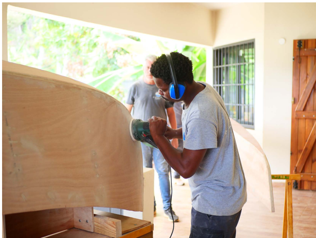
Ponçage d'une pirogue

Protection au titre des monuments historiques : non protégé